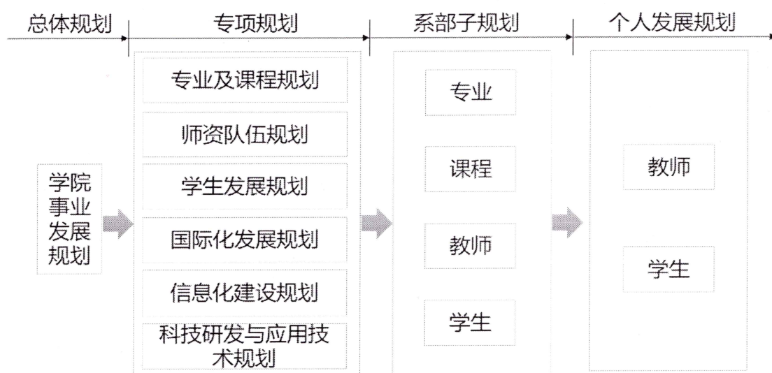
图 1 目标链关系图

对学院现状进行 SWOT 分析，编制学院总规划和专项规划，各系（部）依据专项规划目标，编制系部子规划，从而形成学院总规划—专项发展规划—系（部）子规划三级规划链。关系如图 1。